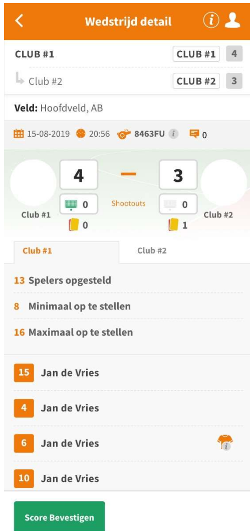
Voorbeeld scherm ingevulde shoot-out score